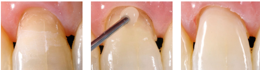
Ideale Verarbeitungseigenschaften und optimale Ästhetik mit Venus Diamond Flow.