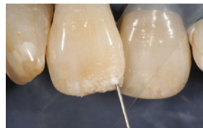
Applikation von Venus Color in der Farbe weiß